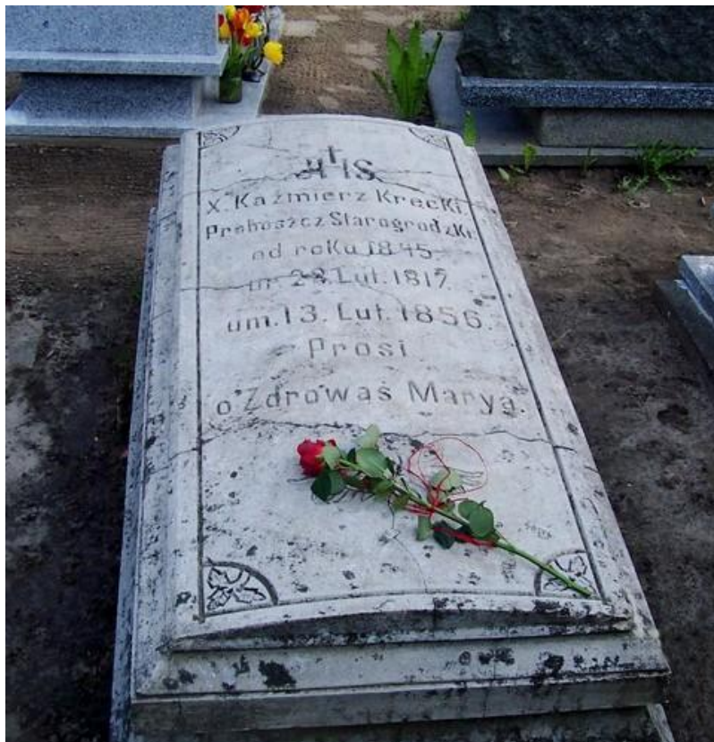
Spoczywa na cmentarzu parafialnym w Starogrodzie.