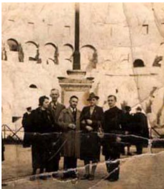
Pielgrzymka do Rzymu.

Święcenia kapłańskie otrzymał 23 grudnia 1933 r. w Pelplinie.